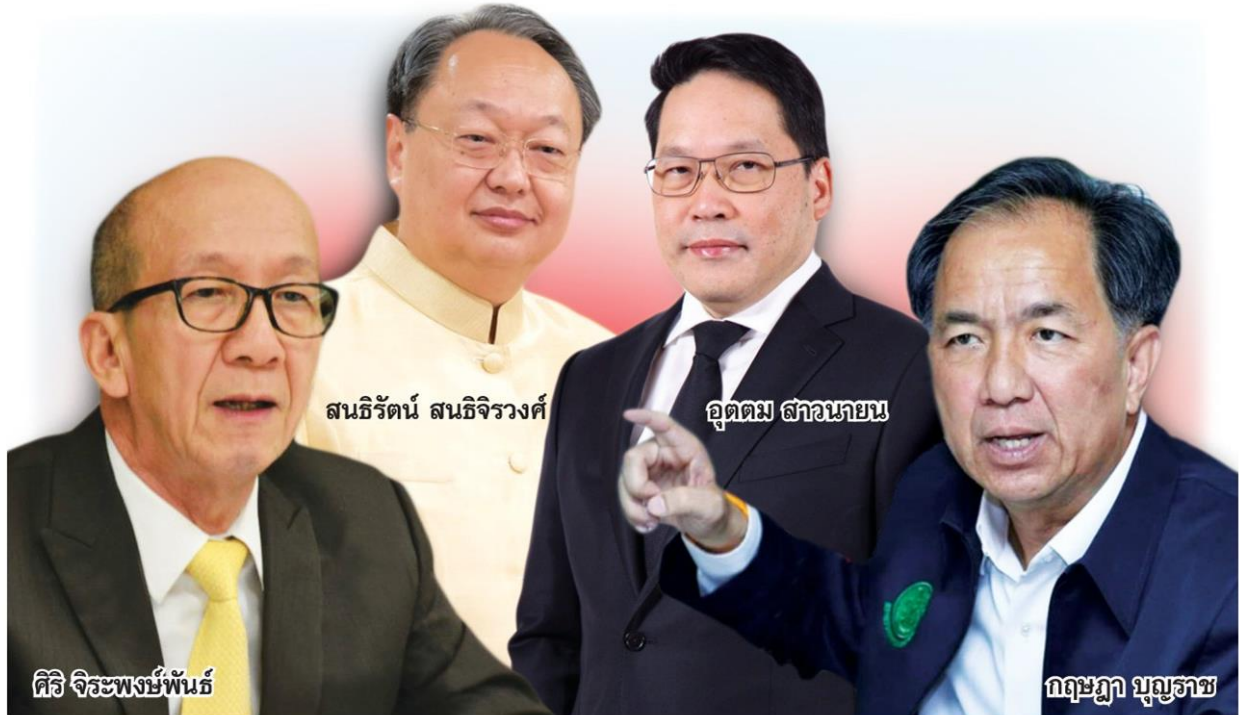
ศิริราชพงษ์พันธ์